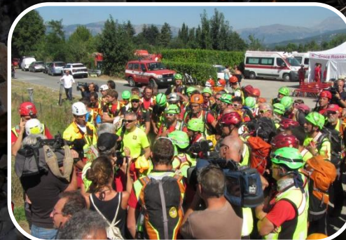
Altre località minori